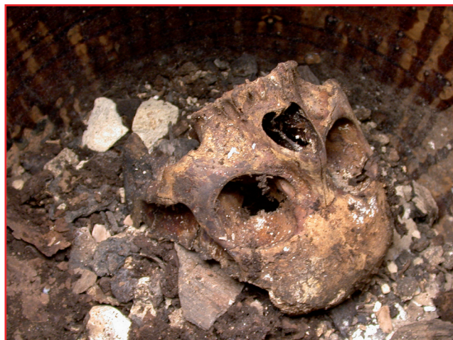
Fig. 2 - Vue des restes d'Agnès Sorel à l'ouverture de son urne funéraire.

La paléopathologie de la variole a été à l'origine d'un réveil des consciences professionnelles vis-à-vis de la dan-