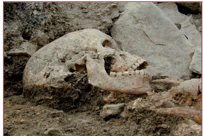
Fig. 1 - Vue d'un squelette étrusco-celtique de la nécropole de Monterenzio Vecchia (Bologne, Italie, IV ème s. av. J.-C.) en cours de fouille.

Au cours de toute autopsie, par exemple, il est d'usage de s'habiller de la façon la plus protectrice possible :